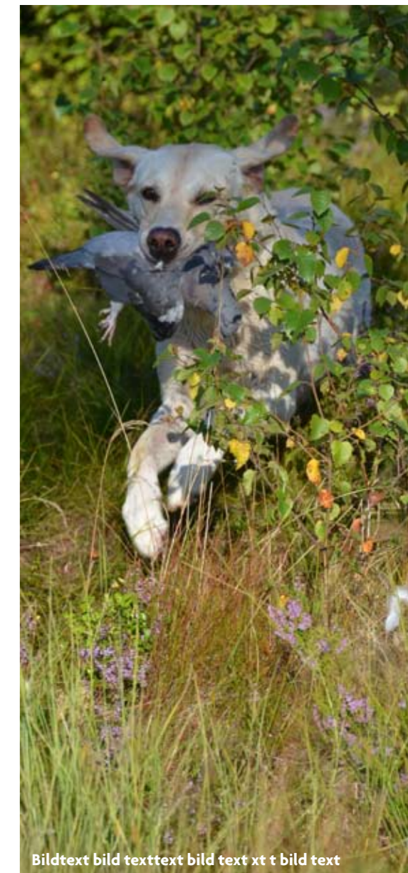
Bildtext bild texttext bild text xt t bild text