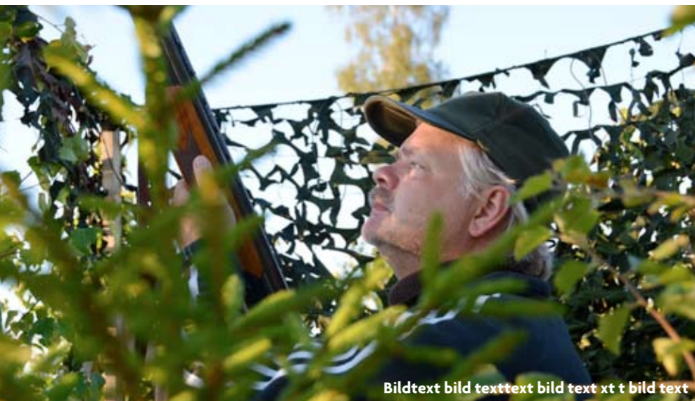
Bildtext bild texttext bild text xt t bild text