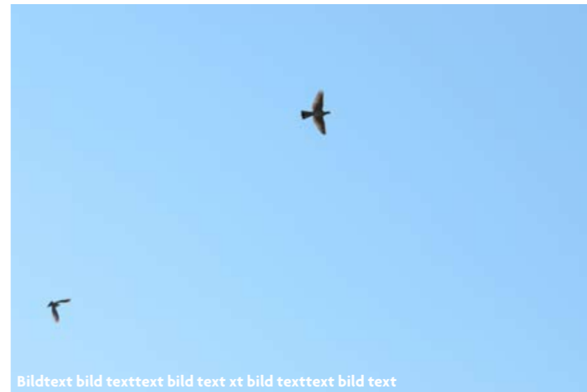
Bildtext bild texttext bild text xt bild texttext bild text