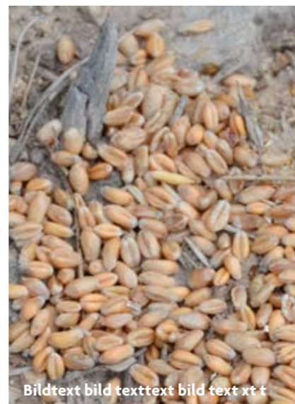
Bildtext bild texttext bild text xt t