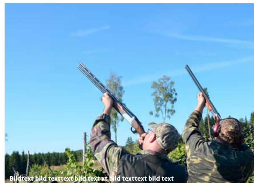
Bildtext bild texttext bild text xt bild texttext bild text

”Duvan slår ihop vingarna i smällen och störtar likt en spiral till marken så nära att skytten nästan får den i huvudet