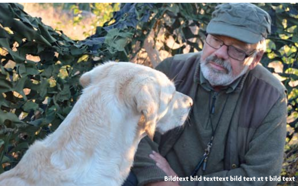
Bildtext bild texttext bild text xt t bild text

”Duvan slår ihop vingarna i smällen och störtar likt en spiral till marken så nära att skytten nästan får den i huvudet