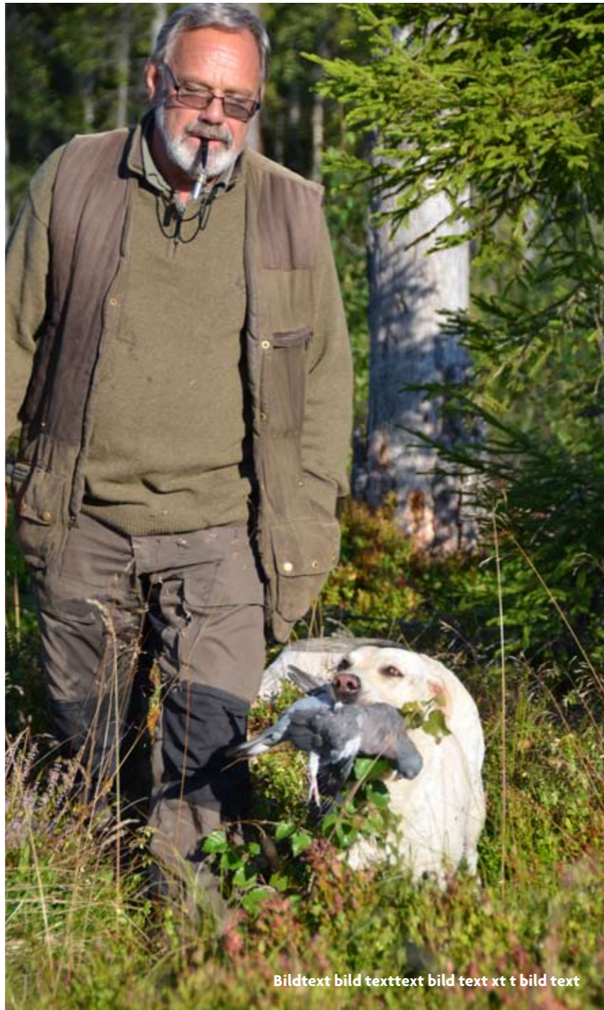
Bildtext bild texttext bild text xt t bild text

Klockan är tio och kvicksilvret har klättrat upp till 25 grader. Det är den 1 augusti och i Skyttjärn är duvjakten avslutad för i år. ♦